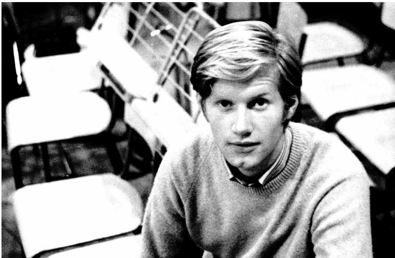
V památném roce 1968, foto: archiv Jaromíra Löfflera

a také je prakticky hned vysílat v rádiu. Během roku 1968 natočil Jaromír Löffler v ostravském rozhlasu asi tucet skladeb, převážně českých verzí světových soulových hitů. Díky jeho pěveckému talentu, výborným instrumentálním výkonům kapely a schopnostem týmu rozhlasových techniků znějí i dnes tyto nahrávky skvěle.